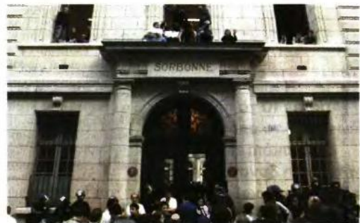
ΤΟ ΠΑΝΕΠΙΣΤΗΜΙΟ της Σορβόνης

Γαλλικό Ινστιτούτο Θεσσαλονίκης, Λεωφ. Στρατού 2Α. ΤΘ 18103. Θεσσαλονίκη. Τηλ. 2310-821231. e-mail: thessalonique@campusfrance.org και enions.www.grece.campusfrance.org .