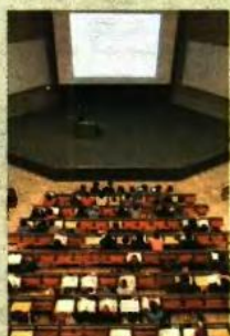
ΤΟ ΤΕΧΝΟΛΟΓΙΚΟ Πανεπιστήμιο του Μονάχου

Πιο προσιτά τα πανεπιστήμια Ουαλίας, Σκωτίας και Β. Ιρλανδίας