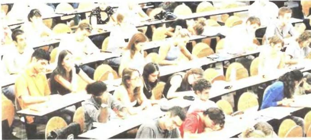
Εάν γίνει η νομοθετική παρέμβαση από το υπουργείο Παιδείας, τα πτυχία των αποφοίτων των πολυτεχνικών και γεωπονικών σχολών θα αναγνωρίζονται ως μάστερ στους διαγωνισμούς για τις προσλήψεις στο Δημόσιο