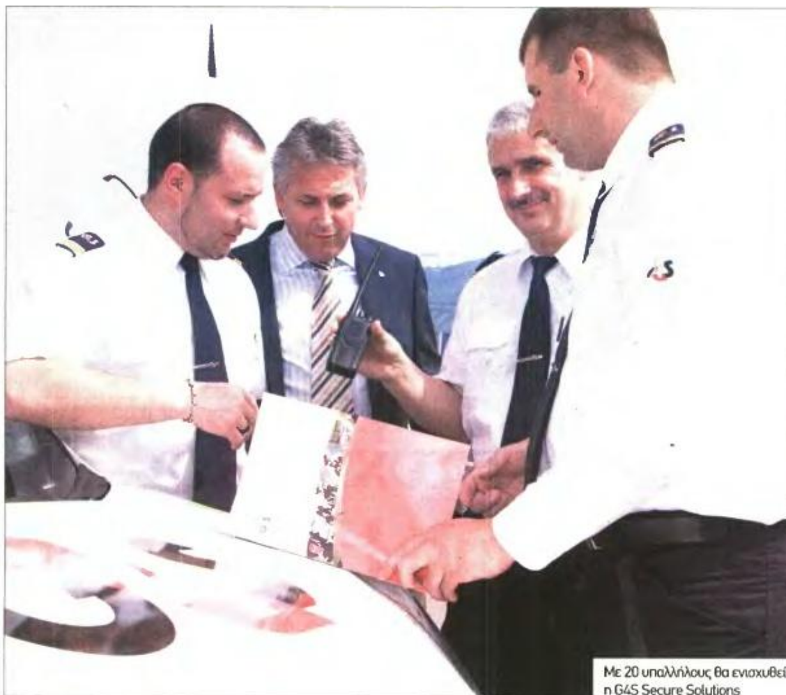
Με 20 υπαλλήλους θα ενισχυθεί η G4S Secure Solutions