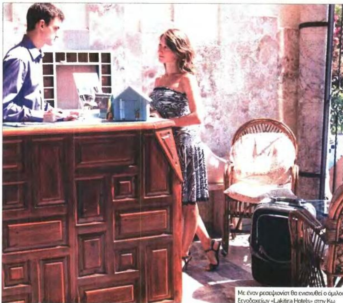
Με έναν ρεσεψιονίστ θα ενισχυθεί ο όμιλος Ξενοδοχείων «Lakitira Hotels» στην Κω