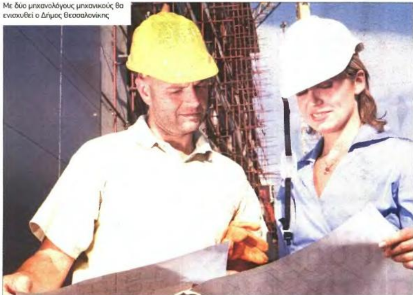
Με δύο μηχανολόγους μηχανικούς θα ενισχυθεί ο Δήμος Θεσσαλονίκης