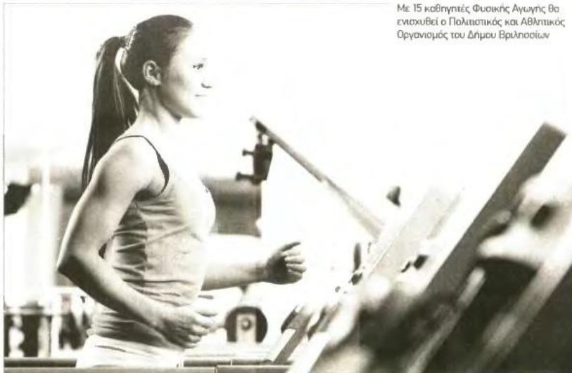
Με 15 καθηγητές Φυσικής Αγωγής θα ενισχυθεί ο Πολιτιστικός και Αθλητικός Οργανισμός του Δήμου Βριλησσιών

ΛΗΤΩ. Τα βρεφικά πολυκατοστήματα Λητώ επιθυμούν να εντάξουν στο δυναμικό τους μία πωλήτρια-ταμία (κωδ. θέσης Reference SKIF), ηλικίας έως 38 ετών, στην Κηφισιά. Απαραίτητες η προϋπηρεσία τριών ετών στις πωλήσεις και η γνώση ταμείου. Η αποστολή των βιογραφικών γίνεται στο φαξ 2105728346 αναγράφοντας τον κωδικό θέσης.