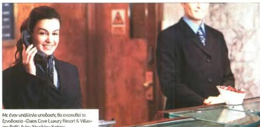
Με έναν υπάλληλο υποδοχής θα ενισχυθεί το ξενοδοχείο «Daios Cove Luxury Resort & Villas» στο Βαθύ Αγίου Νικολάου Κρήτης.

ΕΛΛΗΝΙΚΕΣ ΜΕΤΑΦΟΡΕΣ. Η μεταφορική εταιρία Ελληνικές Μεταφορές στο Ηράκλειο θα προσλάβει έναν υπάλληλο γραφείου έως 30 ετών. Απαραίτητα προσόντα η γνώση αγγλικών και Η/Υ στα MS-Office και στο internet. Το προσόν που κάνει τη διαφορά για την πρόληψη είναι οι γνώσεις λογιστικής. Αποστολή βιογραφικών στο e-mail: ellinikes.metatfores@gmail.com.