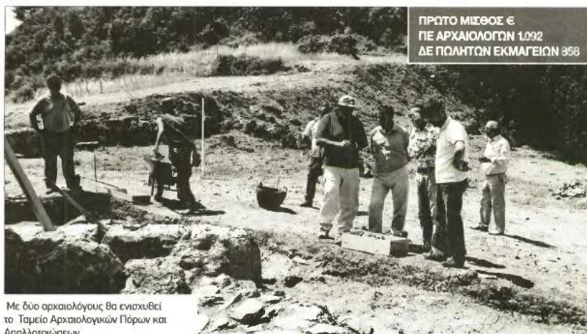
Με δύο αρχαιολόγους θα ενισχυθεί το Ταμείο Αρχαιολογικών Πόρων και Απαλλοτριώσεων

Ζητούνται κυρίως συντηρητές, αρχαιολόγοι, αρχιτέκτονες, λογιστές, γραφίστες, πωλητές, διοικητικοί, συντηρητές, γραφίστες και εργάτες