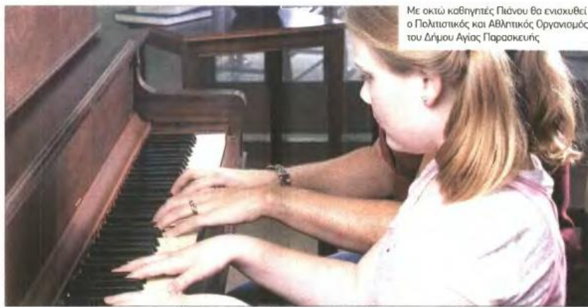
Με οκτώ καθηγητές Πιάνου θα ενισχυθεί ο Πολιτιστικός και Αθλητικός Οργανισμός του Δήμου Αγίας Παρασκευής

ΗΡΑ. Δυνατότητα εργασίας σε έναν οδηγό φορτηγού, ηλικίας έως 35 ετών, προσφέρουν τα καταστήματα βρεφικών ειδών Ηρα στην Αθήνα. Οι ενδιαφερόμενοι σφειλουν να διαβέθουν το ενδιαφέρον στο τηλέφωνο Λυκαίου, προώθηση τεσσάρων ετών σε αντίστοιχη θέση, εγχειριστικό δίπλωμα οδηγού Γ και Δ Κατηγορίας. Αντικείμενα του υποψήφιου είναι η μεταφορά και η συννομήση επιβαίων. Βιογραφικά: info@rabbe.gr.