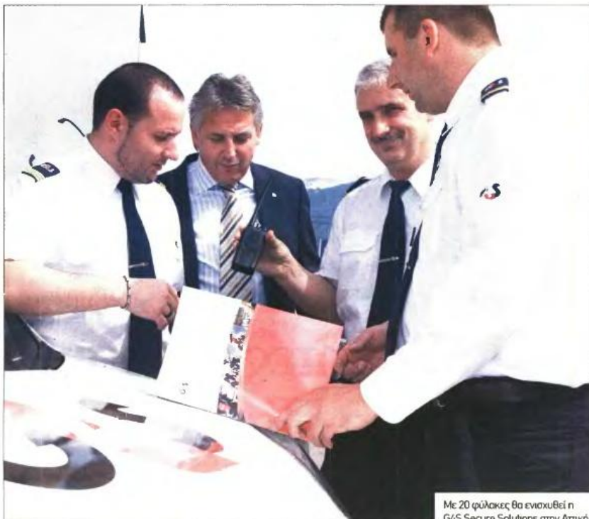
Με 20 φύλλακες θα ενισχυθεί η G4S Secure Solutions στην Αττική

I Πέντε πωλητές επιθυμεί να εντάξει στο δυναμικό της η αλυσίδα καταστημάτων πώλησης προϊόντων για κατοικίδια Pet City σε Μαρούσι, Χαλάνδρι, Βριλήσσια, Γέρακα και Αγία Παρασκευή. Οι ενδιαφερόμενοι οφείδουν να διαθέτουν προϋπηρεσία και ευχέρεια στην επικοινωνία. Θα δοθεί προτεραιότητα στους κατοίκους των γύρω περιοχών. Η αποστολή των βιογραφικών γίνεται μέσω φαξ στον αριθμό: 210-6644762.