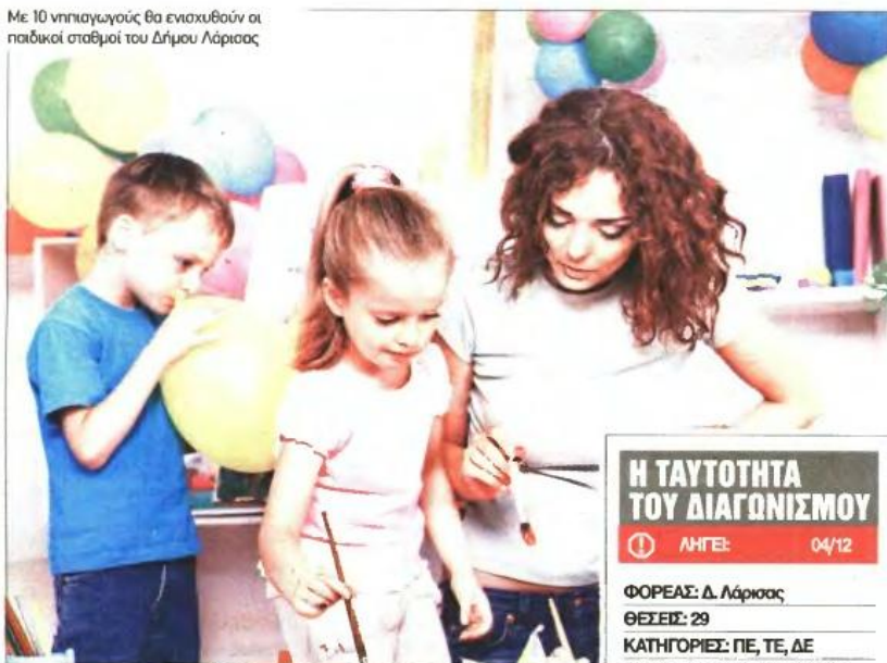
Με 10 νηπιαγωγούς θα ενισχυθούν οι παιδικοί σταθμοί του Δήμου Λάρισας

Ενισχύονται έως και τις 31 Ιουλίου οι παιδικοί σταθμοί