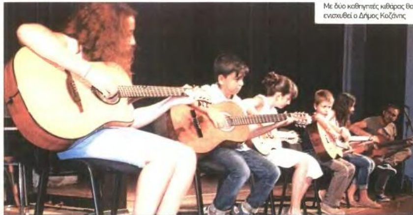
Με δύο καθηγητές κιθάρας θα ενισχυθεί ο Δήμος Κοζάνης

ΠΑΣΤΕΡ. Ο Εκπαιδευτικός Όμιλος ΠΑΣΤΕΡ στη Θεσσαλονίκη επιθυμεί να προσλάβει έναν γραφιστή με καλή γνώση σχεδιαστικών πακέτων και social media. Επαθμιατή ή προϋπηρεσία. Βιογραφικά: info@paster.gr.