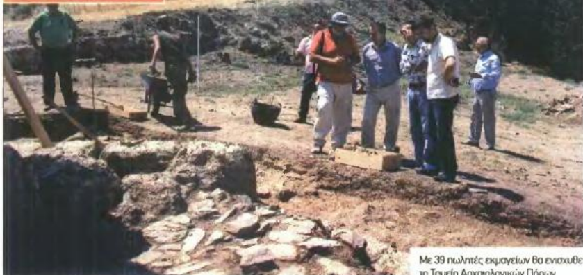
Με 39 πωλητές εκμαγιών θα ενισχυθεί το Ταμείο Αρχαιολογικών Πόρων