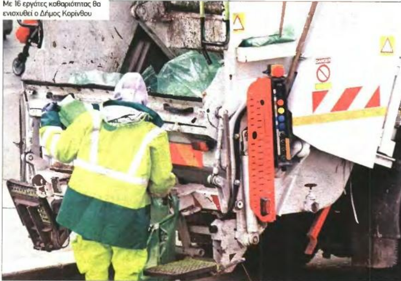
Με 16 εργάτες καθαριότητας θα ενισχυθεί ο Δήμος Κορίνθου